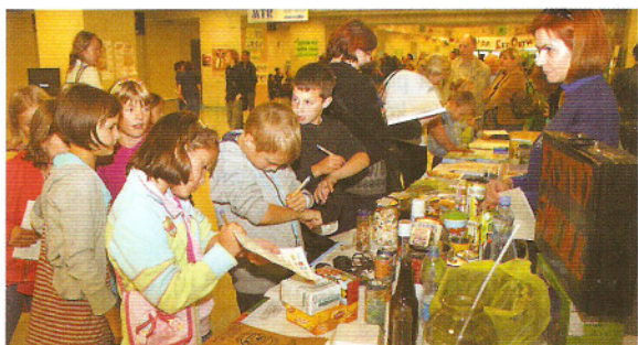
Najmłodsi mogli brać udział w kilkudziesięciu dyscyplinach ekologicznych.

w happeningu „Zmień śmieci na rock'n'rolla”, gdzie Miejskie Przedsiębiorstwo Gospodarki Komunalnej w Rzeszowie wydawało bilety za zgniecione butelki PET albo puszki. W taki aktywny „odpadowo” sposób na koncert przyszło kilka tysięcy ludzi.